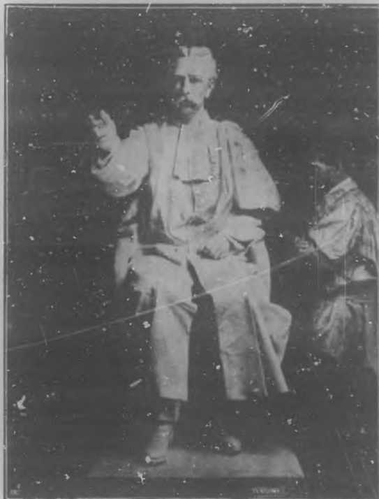
DOCTOR JOAQUÍN ALBARRÁN.

ersal, han podido ellos mismos contemplar por sus propios ojos semejantes tributos en vida. Nada, pues, más legítimo que el que muy pronto presenciará el pueblo de Sagua. El artista ha empleado cerca de diez meses en llevar á término feliz esta obra, y su costo de 25.000 liras ha sido cubierto por suscripción en toda la República, muy especialmente entre las clases intelectuales y con el concurso de un buen número de Municipios, entre ellos el de esta Ca-