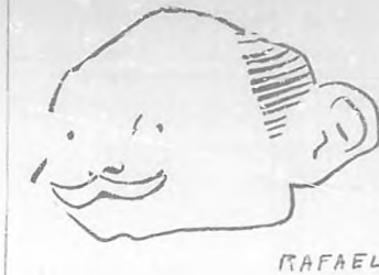
"Caricatura" de Rafael.

Alvarez Marrón hace muy poco tiempo que lo conozco (personalmente, apenas). Yo deseaba saber de toda su obra literaria; por lo menos de conocer su estilo y temperamento de todas sus épocas de escritor; es este un detalle del que nunca se debe hacer omisión en un juicio crítico. Yo estoy complacido. Acaba de publicar un libro donde recopila trabajos antiguos y modernos suyos. Al leerle me di cuenta de que conocía por sus últimos artículos al escritor de siempre; escribe hoy como antes. A todos los literatos de mis simpatías quisiera yo poder dedicarles este elogio terminante y único. Pero como sé que este criterio mío difiere en mucho con el del público en general, quiero decir dos palabras en defensa de mi opinión.