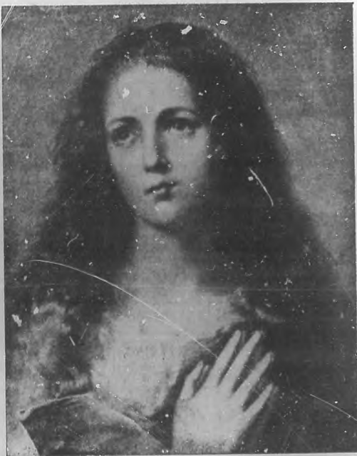
Santa María, por Tiziano.