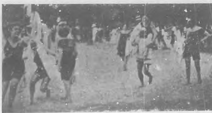
Baño para familias.