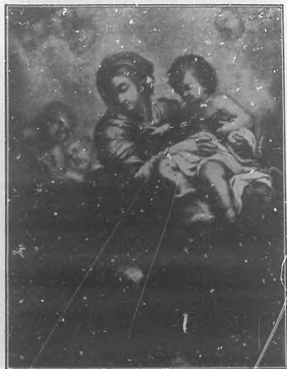
La Virgen, por Correggio.

El ideal, el emblemático personaje María, en fin, ha brotado de ilustres pinceles y ha aparecido en lienzos que han hecho inmortal el nombre del artista, antes más que ahora aficionado a inspirarse en el mundo del ideal en el que hallaba siempre manera de darle forma grandiosa al materializarlo.