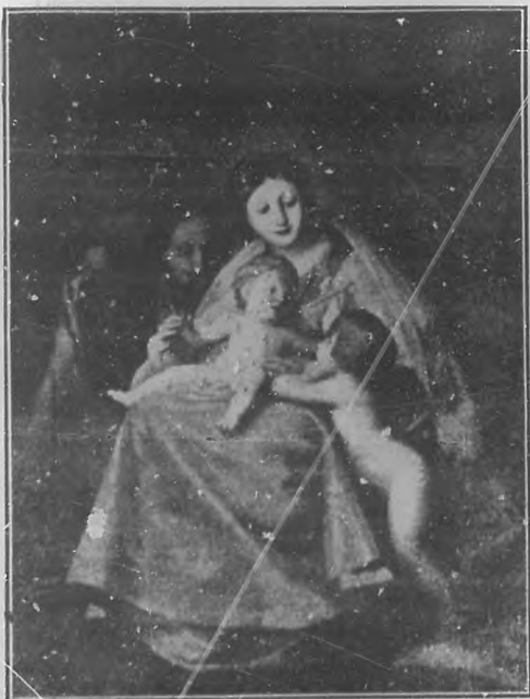
La Sagrada Familia, por Goya.

Goya, el Greco, Rafael... y otros más, verdaderos atletas del pincel en la edad de oro de la pintura sacra, correcta, inspirada y humanizada, digámoslo así, para distinguirla de la que en retablos y trípticos de gran mérito nos ofrece santos y santas rectilíneos, inarticulados con aspecto de mómias.