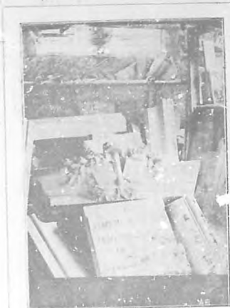
Parte del pedestal en el taller del escultor.

BOHEMIA agradece al Sr. Alcover esta información y se propone hacerla completa cuando llegue el mo-