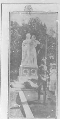
Hannover, monumento á la reina Luisa y princesa Federica.