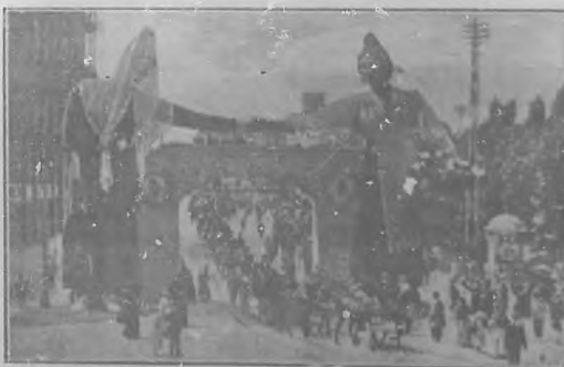
Valencia.—En arco original.

do, puede en jactarse de la conservación de una joya artística.