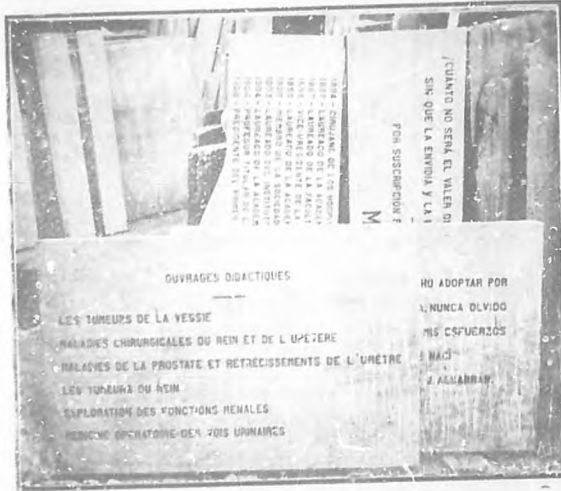
Las cartelas del monumento.