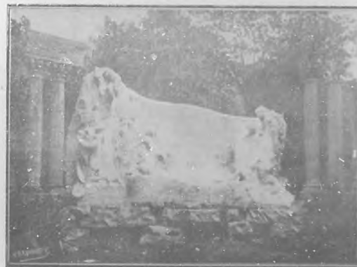
Paris.—Monumento á Alfredo Assolant.

El actual "campanile" es exactamente igual al que se derrumbó años atrás. La obra está terminada. Italia, y el mun-