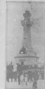
Mainz.—Monumento á Humboldt. I

Actualidad monumental pudieran titular esta página dedicada á novedades mundiales de bien distinta índole por cierto.